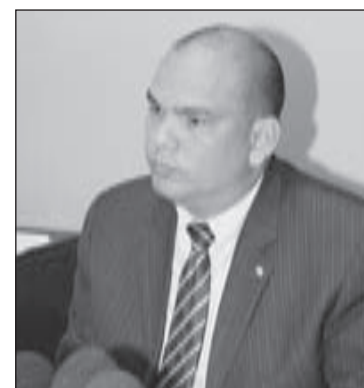
Minister Otmar Oduber

Nv, cu lo bai aloca y opera un Hard Rock Hotel en Casino na e sitio miho conoci como ruina di Bushiri Hotel. E ta bira un inversion di 120 miyon dollar den e propiedad aki. e banco cu ta encarga pa regla e financiamiento ta Aruba Investment Bank(AIB). Tin un garantia poni di 2 miyon dollar. Na momento cu e compania aki ricibi e carta su periodo pa cumpli cu e construccion ta cuminsa core. E compania tin tres pa cuater luna pa nan regla financiamiento pa cuminsa construi. Si nan no cumpli cu esaki ta perde nan deposito. Esaki ta algo nobo unda cu ta pone un riesgo cerca esun-